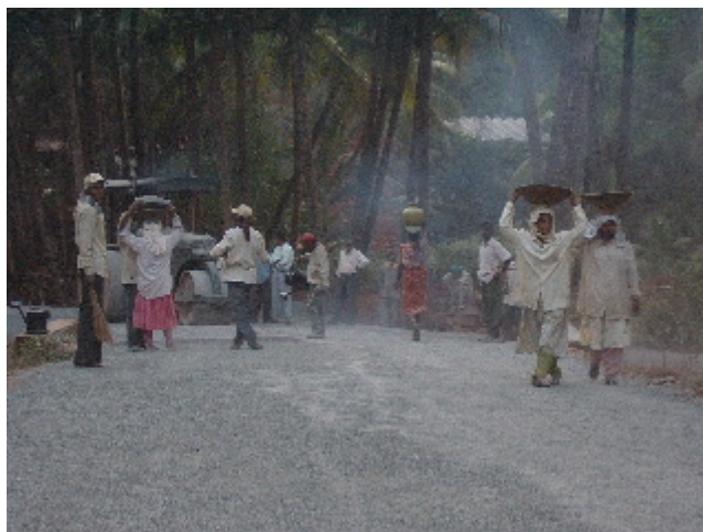
Les carreteres es construeixen pràcticament a mà. Betul. 28 des. 2002

robes i llençols protegien el seu cos d'una polseguera esvalotada. Rostres de nois i noies tapats que caminaven arrengrats amb uns perols de pedra picada al cap, llençaven la grava al mig del camí gairebé sota la màquina aixafadora i amb una regadora hi escampaven el quitrà, un tros de roba els feia de mascareta alleujant ingènument els efectes agonitzants de la metzina.