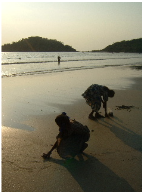
Tots els membres de la família són bons per treure rendiment del mar. Palolem. 31 des. 2002

Aprofitant que el mar ha reculat, dues nenes caminen amb l'esquena doblegada sobre elles mateixes, miren atentes el terra de la platja, s'aturen a cada passa i enterren dos dits dins la sorra, els remouen amb traça i en treuen unes petxines fosques i grosses que guarden al davantal i a la bossa de plàstic.