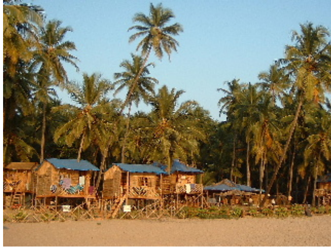
Les cabanes a la platja i els habitatges de les famílies locals són les úniques opcions d'allotjament. Palolem. 24 des. 2002

A cada extrem de la platja la terra entra al mar formant una pila immensa de pedres rodones de totes mides que apareixen i desapareixen a cops d'onada. Caminant cap al sud una petita illa salvatge embussa les aigües del mar aràbic dins la badia de Palolem, només les deixa sortir amb la pujada de la marea tot esborrant el camí rocós que hores abans ens feia de guia. Hem obert pas entre les bardisses resseguint un camí de ronda que volta l'illot, diuen que si tens paciència i bona vista pots veure com salten els dofins a mar obert però nosaltres no n'hem sabut prou. Coronant l'illa hi ha un arbre selvàtic, les seves branques fan de cordes i és una atracció veure els més agosarats deixar-se endur pels records tarzanils i enfilarse per les lianes. Hem badat un xic sense adonar-nos que les aigües ja havien pujat. Ens ha creuat una barca de pesca, un pare i el seu fill que arribaven remant han embarrancat entre les roques pendents de les nostres camades, un parell d'intents grotescs i ens hi hem enfilat apuntalant-nos temeràriament als llistons de fusta relliscosa i sucant els peus dins de les aigües estancades del cul de la barca que guardaven desenes de peixos morts. La posta de sol és impactant, veure com la bola incandescent, rosa, taronja i vermella desapareix dins del mar t'eixampla el cor i el silenci amb que la gentada s'acomiada de l'astre reial te'l torna a encongir.