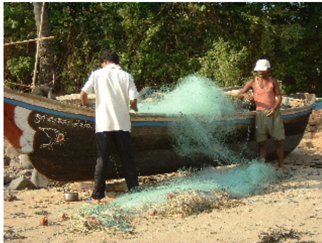
Els pescadors locals han sabut aprofitar les oportunitats que ofereix el turisme. Palolem. 31 des. 2002

Palolem és un poble petit que ha après a viure del turisme sense pervertir l'entorn natural i conservant serenament l'economia tradicional, molts habitants viuen de la pesca i alhora han encaixat el turisme com un font d'ingressos extres. Alguns dies els pescadors surten de bon matí amb les seves barques de fusta massissa i porten als turistes mar endins a veure els dofins. Altres dies els venen la possibilitat de sortir a pescar amb ells; els forans feliços de participar en una activitat tant col·loquial i els pescadors tenen mà d'obra gratuïta, una companyia distreta, un bon sobresou i els peixos de la jornada.