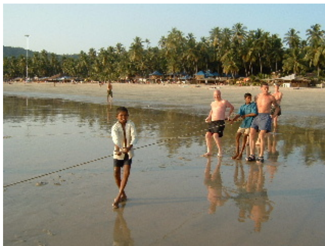
Entre pescadors i turistes es crea una curiosa relació simbiòtica... Palolem. 31 des. 2002

badocs, parla del mackerel i del pomfret, però nosaltres només reconeixem un tauró petit, un peix amb bec, una llagosta i un cranc.