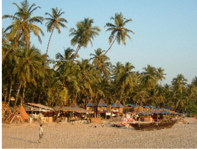
Palolem és la viva imatge de la dita “tranquil·litat i bons aliments”. Palolem. 24 des. 2002