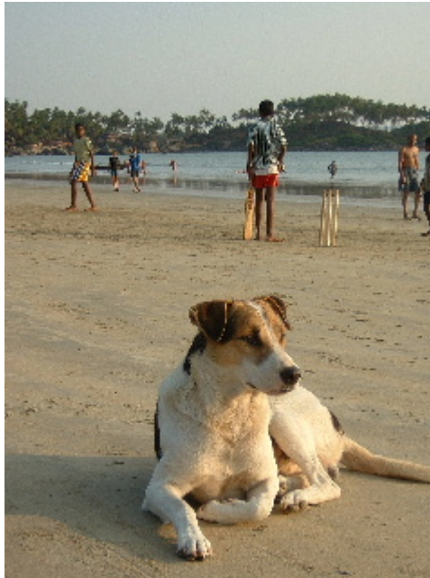
La "comunitat canina" conviu en perfecta harmonia amb la població local i el turisme.... Palolem. 31 des. 2002