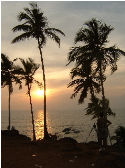
La bellesa apareix per tot arreu... Vagator. 14 des. 2002

Cada dimecres fan un mercat a Anjuna, el poble del costat, que s'anomena "flea market" o mercat de les puces, hem agafat l'autobús cap a mig matí i amb deu minuts ja érem a lloc. Vorejant el mar i tant com allargava la vista s'estenia davant nostra un laberint de camins fets per parades encimbellades que mostraven tots els seus productes; teles dels deus hindús, collarets, penjolls, sobres d'espècies, catifes, pols de colors per decorar-te el front,