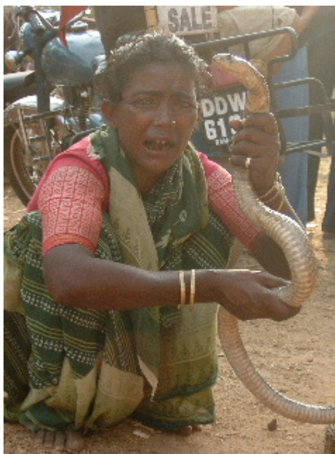
Encantadors de serps. Un espectacle dubtós... Anjuna. 11 des. 2002

robes... uns espetec de colors, persones i olors inmersos en l'art del regateig. Encantadors de serps, Shadus que pelegrinaven amb les seves vaques santones, senyores lamani decorades de cap a peus a l'estil tradicional de karnataka, viatgers descamisats, rodamóns perduts o trobats lluint els seus dons musicals en les petites tavernes improvisades entre les parades del mercat, venedors de motos i nens i nenes fills d'uns o altres jugant i corrent entre els grans.