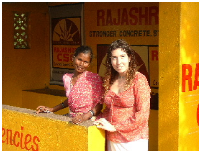
Fent coneixences a la parada d'autobús de Vagator 10 des. 2002

Hi ha desenes d'autobusos que arriben carregats i marxen encara més atapeïts, tots porten un petit cartell on hi ha guixats en hindi els noms de la seva darrera parada, no hi ha cap parcel·la definida però sembla que tots saben exacte quin es el seu lloc d'aparcament. No ens deixen caminar perduts en l'immens descampat entre crits i botzinades, ens aborden a cada passa per saber el nostre destí, ens volen ajudar o fem nosa, i ens empenyen fins l'autobús que s'enfila cap a les platges del nord. Fa poc més de mitja hora que viatgem i hem parat en un encreuament de camins, han baixat els pocs passatgers que quedaven dins l'autobús, ens han cobrat deu rupies i ens indiquen que és l'última parada.