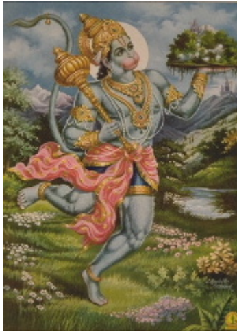
Hanuman, el déu mono

acròbates i dels lluitadors, i també se'l coneix com el primer autor de la gramàtica sanscrita.