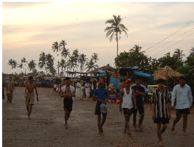
Turistes del país a la recerca de noies europees Vagator. 14 des. 2002