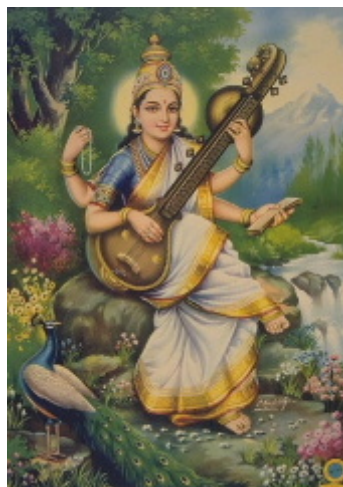
Saraswati, la deessa que representa la música

Saraswati és la deessa de la purificació i de la fertilitat, se la coneix com la inventora de l'escriptura i la deessa de l'eloqüència i de la música. És la muller de Brahma i la més bonica de totes les deesses hindús. La representen asseguda sobre un lliri d'aigua o un paó real i tocant el llaüt, el sitar o la vina.