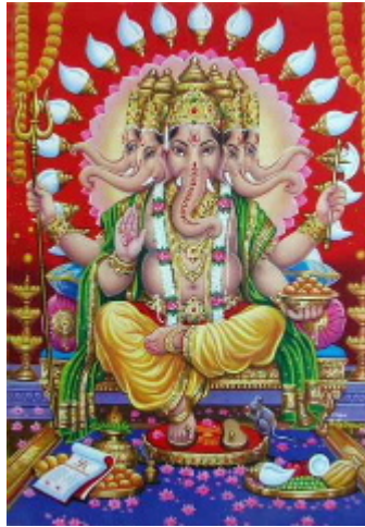
Ganesh, el déu amb cap d'elefant és molt estimat

Ganesh és el déu amb cap d'elefant, és el fill primogènit de Shiva i Parvati. És venerat amb molta simpatia, és grassonet i rialler i s'invoca abans d'emprendre qualsevol aventura, menys la mort. Popularment se'l coneix com Gambati i el dibuixen assegut sobre un tro o una flor de lotus, agafant amb els quatre braços un disc, una petxina, un plat de caramels i un liri d'aigua, es desplaça sobre d'una rata. A l'entrada dels temples, de les botigues i de les cases sempre hi col·loquen la seva imatge com a símbol d'èxit, prosperitat i pau. Nosaltres n'hem comprat unes quantes enganxines i les hem plantat a la motxilla.