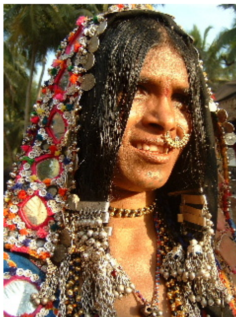
Dona Iamani de Karnataka Anjuna. 11 des. 2002