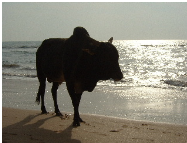
Tot és possible a l'Índia... Anjuna. 11 des. 2002

La carretera queda tallada en sec i desenes de persones seuen arran del petit precipici mirant el sol i el mar. Les platges són de sorra gris cendra, les pedres tenen un color negre socarrimat i rogenc i les palmeres s'alcen majestuoses i carregades de cocos d'aigua, totes porten un número pintat, però en desconexem la finalitat. Des de dalt del mirador pots baixar a les platges; la Ozran Vagator beach és la platja petita, la sorra es fina i compacte i mils de crancs corren a amagar-se als seus forats, les vaques passegen carrinclones i els gossos descansen sobre la sorra calenta i hi ha venta ambulant de roba, penjolls, begudes i marihuana. Sobre la platja s'aixeca una fortalesa de terra roja que ha estat conquistada pels amants de la festa, és la Disco Valley, i cada capvespre a les cinc de la tarda acompanya a la posta de sol amb una música tecno hipnotitzant, que s'escola inevitablement per tots els indrets del poble fins altes hores de la matinada.