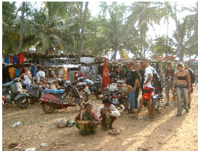
Les runes del paradís hippie dels 70... Anjuna. 10 des. 2002

llum de la lluna. Les petites comunitats de pescadors locals han penjat les xarxes i es dediquen a satisfer els capricis d'aquests nouvinguts. Gairebé totes les famílies lloguen habitacions, motos, barques, taxis, cuinen, renten la roba, venen quincalla, fan massatges ayurveda i t'ofereixen qualsevol tipus de droga. Sembla ser que per les festes de Nadal tot de viatgers són atrets cap a aquestes contrades, però els locals estan preocupats perquè cada any és més flaca la demanda i ja no hi poden fer "l'agost"; des dels atemptats de Bali i des que el govern de Goa es mostra més exigent, penant el nudisme i la venda de substàncies al·lucinògenes, els visitants han minvat, deixant al descobert un lamentable espectacle de noves inversions abandonades a mig fer.