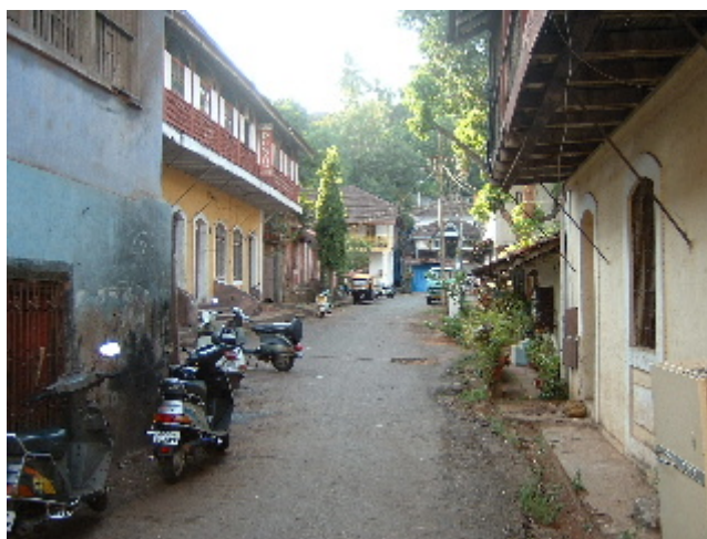
Barri de Fontainhas a Panjim. Un racó de món preciós! 1 des. 2002

Potser no érem del tot conscients que tard o d'hora perdríem la noció del temps, però ens ho havíem imaginat tantes vegades que gairebé havíem inventat una nova sensació per aquest desig fictici. No només se'ns ha diluït la separació entre els dies de la setmana i el cap de setmana, sinó que som incapaços de recordar els referents que fins fa poc ens ajudaven a mesurar la nostra percepció del temps. Ja fa uns deu dies que vivim a Panjim i tant ens podrien fer creure que vam arribar ahir, com que fa més d'un mes que ens hi estem. El barri de Fontainhas és molt agradable, tot és un garbuix de carrerots estrets amb cases colonials de tots colors, combinacions sorprenents de teules roges que s'amunteguen imprudentment sobre d'unes enormes balconades de fusta, que pengen al voltant de tot l'edifici i es recolzen sobre d'una renglera de columnes.