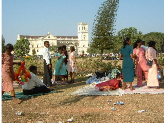
Milers de persones fent pícnic a Old Goa 3 des. 2002

Al capvespre tot aquell parc natural va quedar ple a vessar de deixalles, ningú va recollir ni els envasos, ni les restes de menjar, ni els plàstics, ni els papers que havien utilitzat. Tot es va quedar tal i com ho havien deixat, fins que van començar a arribar els “harijans” o fills de Déu, nom amb que Gandhi va batejar als intocables, senyors i senyores de cossos molt prims i vestits amb robes malmeses, carregats amb grans saques a l’esquena on hi anaven classificant els diferents materials per poder revendre, també van arribar els gossos, les vaques i els corbs a celebrar la seva festa.