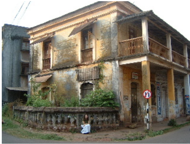
Panjim: una Lisboa en petit, amanida amb palmeres i torradeta pel sol de l'Índia 8 des. 2002