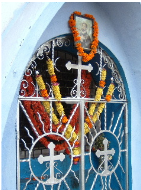
Capella de Sant Francesc Xavier al carrer. Barri de Fontainhas 8 des. 2002

començar la tasca de conversió al cristianisme, amb l'arribada de la inquisició es va prohibir qualsevol altra fe que no fos la catòlica, molts temples hindús van ser destruïts i es van assignar cognoms portuguesos als goans convertits.