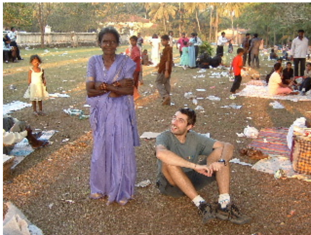
Una àvia espontània a la festa d’Old Goa 3 des. 2002

Al capvespre tot aquell parc natural va quedar ple a vessar de deixalles, ningú va recollir ni els envasos, ni les restes de menjar, ni els plàstics, ni els papers que havien utilitzat. Tot es va quedar tal i com ho havien deixat, fins que van començar a arribar els “harijans” o fills de Déu, nom amb que Gandhi va batejar als intocables, senyors i senyores de cossos molt prims i vestits amb robes malmeses, carregats amb grans saques a l’esquena on hi anaven classificant els diferents materials per poder revendre, també van arribar els gossos, les vaques i els corbs a celebrar la seva festa.