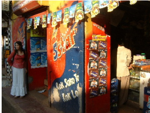
Badalona on comprem els queviures 2 des. 2002