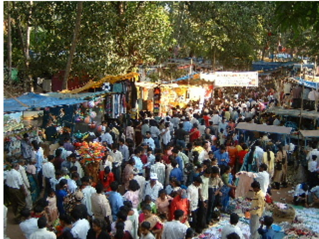
Vista de la multitud congregada a Old Goa 3 des. 2002

granel, vam tastar uns bastonets de pasta de cigró recoberts d'un sucre de carbassa exageradament dolç, parades de roba, de làmpades, de sabates, de joguines, carretes de gelats, de xoricets vermells i cebes fregides. Un extens mercat que recorria tots els imaginaris carrers de la desapareguda ciutat, una combinació oportunista de fe i consum. Sense saber com, vam quedar atrapats entre una multitud de persones que ens arrossegava al seu pas, no podíem recular i l'aglomeració era asfixiant, ens va tranquil·litzar veure que ningú s'esverava, vam sortir com vam poder per entre unes paradetes i vam anar a parar a les aigües del riu Mandovi.