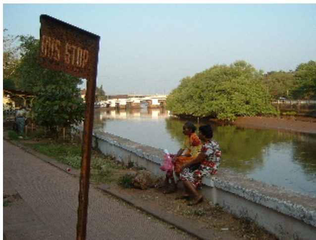
Capvespre al riu Ouren a Panjim 1 des. 2002

les aigües del riu Ouren, i l'ombra de les palmeres que es va apoderant dels mils esglaons que et porten d'un carrer a l'altre.