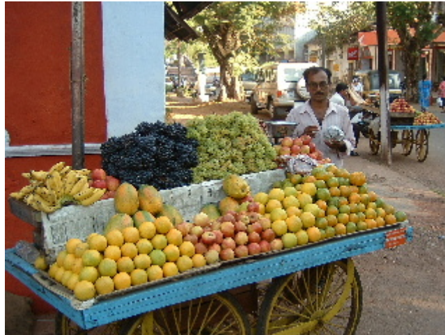
Parada de fruita a Panjim 1 des. 2002