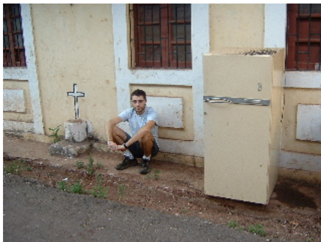
I com deia un bon amic: no es tracta d'entendre les coses...

Tots els fluids corporals són escatològics i són llençats fora del cos, escupen els gargalls i llencen els mocs al carrer i troben anguniós aquest defici que tenim nosaltres per col·leccionar mocades en un tros de paper que acaba dins la butxaca.