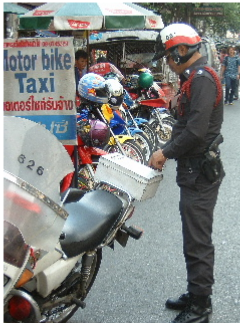
L'autoritat o un personatge de còmic? Bangkok. 29 març. 2003

polícia, és una camisa gruixuda i exageradament cenyida, embotida dins d'uns pantalons estrets que descriuen una figureta menuda i acinturada carregada amb una porra i un casc, recordant-nos als dibuixos animats de la formiga atòmica.