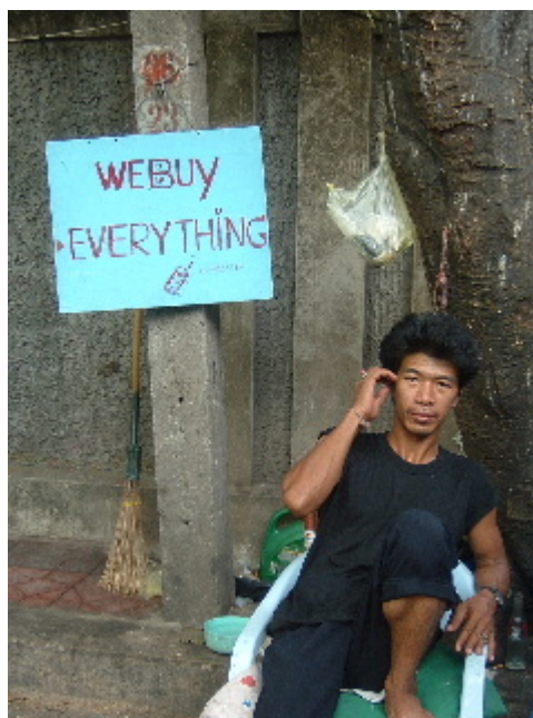
Surt més a compte regalar que vendre als "we buy everything".. Bangkok. 29 març. 2003

Ens estem a Rambutri road, diuen que és el barri dels farang , si no anem errats aquest és el mot col·loquial que rebem els estrangers. Certament aquesta barriada està pensada pels viatgers de motxilla, desenes de cases amb lloguer d'habitacions, botigues d'internet, d'intercanvi de guies i llibres, i tot un reguitzell de furgonetes carregades de trastos, són antigues pertinences de viatgers que han refet la motxilla. Els amos jeuen a la tombona esperant que algú els desperti per vendre o comprar quelcom, "We buy everything" diu el cartellet que sobresurt entre els estris sobrants, cantimplores, sacs de dormir, ulleres i tubs d'aigua, un assortit que ens és familiar i que a nosaltres també ens fa nosa. Hi ha un carrerot que fa olor de net, és ple de gibrells d'aigua, escuma i roba estesa, deu ser un negoci de fer bugada, el seu reclam és un cartró guixat que ofereix rentar un quilo de roba al preu de 30 bats, que serien unes 120 pessetes.