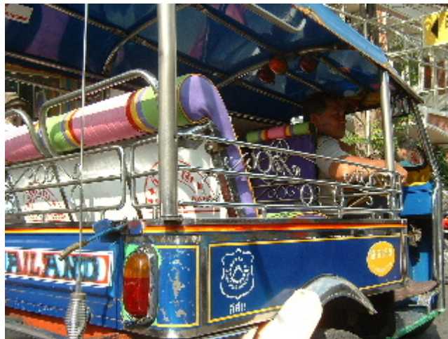
El tuk-tuk, l'homòleg tailandès del rickshaw indi... Bangkok. 29 març. 2003

varies capes de teules verdes i taronges robant totes les mirades. Hem creuat els carrerons bulliciosos del barri xinès, veient d'escallimpada els cartells encimbellats dels petits comerços i una cercavila de dracs i petards, el mercat de fruites i el riu Chao Phraya. Pons, canals, barquetes i cases de ferralla enlairades sobre el riu, un parell de revolts i ens sorprèn un parc ple de vida, centenars de persones hi fan voleiar cometes i cintes de colors. I mirem on mirem apareixen retrats de la monarquia tailandesa, imatges del rei Bhumibol i la seva muller, la reina Sirikit, visitant racons del país amb una expressió serena de pares protectors. Fotografies gegants dins d'uns marcs daurats recarregats i delicadament plantats entre les flors de tots els jardins i resseguint les grans carreteres que creuen la ciutat, tot molt ben cuidat.