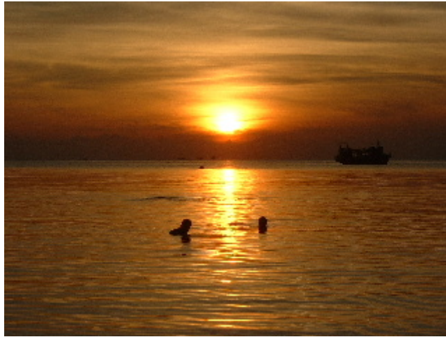
...tot flueix suau i lentament... Koh Tao. 7 abril. 2003

Sense moure'ns de lloc, veiem en Song que encén les espelmes i submergeix un triangle verd dins les aigües, deu ser un reclam per atraure clients, com la canoa que sura feta de llaunes i espelmes davant de la imatge d'en Gambati, un déu hindú fet de sorra que serà el talismà de la festa pagana d'aquesta vespre, al seu voltant els amants de la foscor ballaran descalços i fumaran amb catximbres que es lloguen per calades. S'encenen les barques de pesca, com una tirallonga de llumets de Nadal penjats a l'horitzó i tot el cel és puntejat d'estrelles, milers de punts brillants que s'escapen del nostre angle de visió empetitint-nos l'existència. Sortim conills i arrugats de tantes hores com hem passat en remull, creuem enmig dels cossos desposseïts que s'abandonen al so dels tambors i fem una última ullada al ninot de sorra, demà és llevarà destrossat, ressacós de tantes cerveses com li hauran abocat.