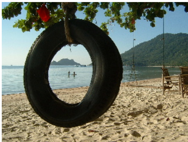
...t'absorbeix i et relenteix els biorritmes... Koh Tao. 7 abril. 2003

Fa deu dies que repetim amb mandra relaxada els mateixos rituals, menys enèrgics de quan vam arribar ens deixem endur per la dolça apatia del no fer res que no sigui saciar les necessitats bàsiques. De la cabanya al mar, sota l'ombra de les palmeres del bar del gronxador, gaudint de veure a passar el dia.