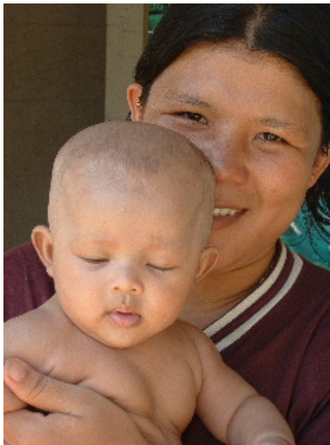
Els somriures es transmeten de pares a fills... Bangkok. 29 març. 2003

Els carrers són plens de colles d'amics que juguen a jocs de taula, han dibuixat una quadricula sobre un cartró i s'entretenen a fer saltar xapes, els més enèrgics es passen a cops de taló una pilota de vímet reixada. Unes noies juguen a badminton al mig de la vorera mentre esperen que algú els hi compri una ampolla d'aigua fresca, les tenen colgades de gel i de tant en tant repeteixen una frase melosa amb un anglès d'accent allargat "one water five