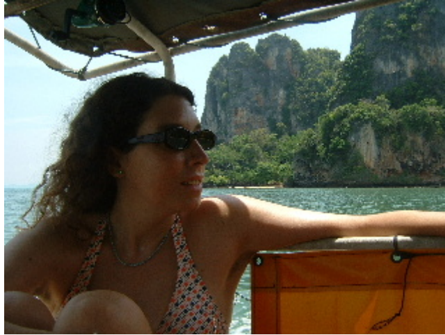
Com serà "el paradís"...? Koh Tao. 5 abril. 2003

Els crits alegres dels venedors d'allotjament ens han espantat les cabòries, sota aquesta massa de vegetació tropical hi ha el poble de Ban Mae Hat, ben preparat per atendre les necessitats dels que arribem amb enganxina. Tossuts decidim anar pel nostre compte, hem llegit que l'illa fa només 21 quilòmetres quadrats i que hi viuen uns 800 habitants que es dediquen a la pesca, al turisme i al cultiu de coco. Caminat sense parar amb la ràbia de voler ser amos dels nostres actes hem arribat a Hat Sai Ri, una platja paradisiàca plena de cabanyes i botigues de submarinisme.