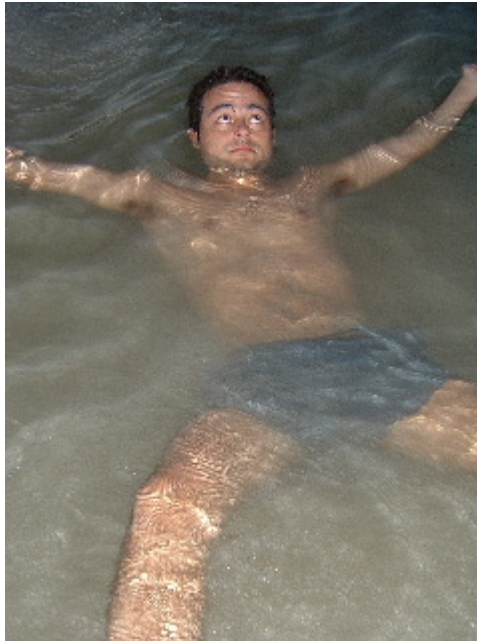
Esperant l'apocalipsi... Koh Tao. 9 abril. 2003