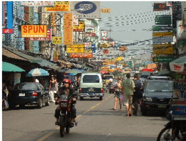
Khao San road, tal com el seu nom indica, tot un caos... Bangkok. 29 març. 2003

bats". Passa un venedor d'insectes fregits, els té classificats per mida, ens els hem mirat i remirat, però cap de nosaltres ha fet el primer pas. El venedor de mel passeja amb un parell de cistelles carregades de pots i ruscs, les aguanta amb un pal que duu encallat al clatell amb un equilibri perfecte. El venedor d'ous s'ha descarregat els cistells i seu al replà de la botiga dels massatges, una colla de noies han callat la cantarella de preus i mengen ajupides compartint un bol d'amanida, sopa i una colla de calamars enforquillats amb un pal, el venedor d'ous s'hi afegeix colgat sota el seu barret punxegut i sense deixar de vigilar el reguitzell d'ous travessats amb un bastonet que es couen a foc lent. Arribem Khao San road, un carrer de renom excèntric i fama merescuda, animat per les parades de roba de segona mà, tamborets on s'asseuen les noies que trenen o raspen els cabells, mostraris de tatuatges i perforacions corporals, parades de discs compactes i falsificacions de tota mena, carnets de reporter internacional i certificats d'estudis d'anglès per pocs bats i cap esforç.