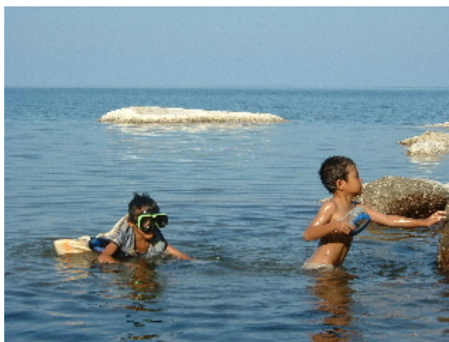
El submarinisme és la principal font d'ingressos de Koh Tao. Koh Tao. 9 abril. 2003