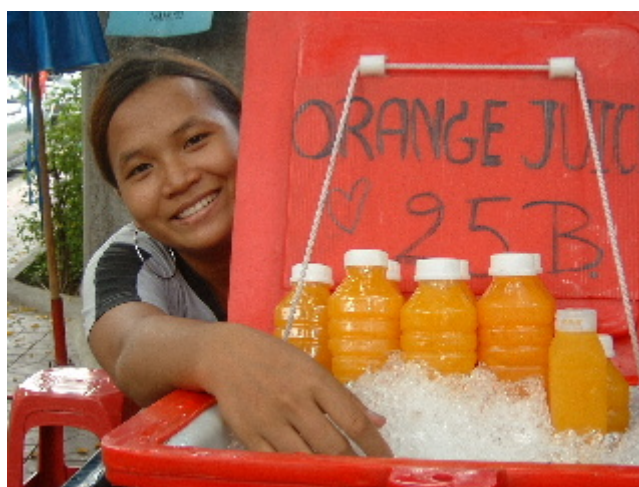
El somriure és tan necessari per als tailandesos com l'aire que respiren. Bangkok. 29 març. 2003

Ens creuem amb cares rialleres, cares de galtes rabassudes i ulls ametllats que emanen salut. Colles de nois que viatgen enjogassats al porta bultos de la ranxera escampant ritmes funky . Reconeixem els samlors , uns vehicles de tres rodes que fan de taxi per dins de la ciutat, semblants als rickshaws però pintats amb colors llampants, la gent els anomena tuk-tuk - imitant amb gràcia el so que desprenen. Creuem pel pas de vianants, ens captiva l'uniforme d'un