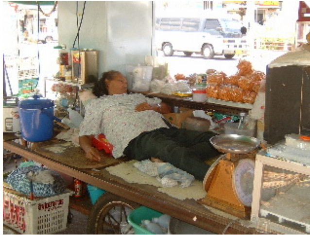
Entre autobús i autobús el negoci de l'amic queda ben relaxat... Bangkok. 3 abril. 2003

L'últim record que tenim és de Bangkok, ara que ja clareja ens han aturat a 650 quilòmetres al sud i no sabem per on hem passat ni què hi ha entre mig. Si ens volien desorientar ho han ben aconseguit, ens apilen les motxilles i ens fan entrar en un local ple d'estirilles i coixins, la gent agafa lloc amb molta agilitat i sense preguntar-se res es posen a dormir. Buscant a la guia deduïm que potser som a Surat Thani, la població costera on haurem d'agafar el transbordador. No sabem quanta estona ha passat però sembla que hi ha moviment, ens seguim els uns als altres fins al microbús, aquest ens atura al port, i aquí ens tornen a destriar per colors. Ben marejats de no saber on anem seiem a la coberta del vaixell i ens consolem intentant entendre que potser aquí les coses funcionen així, encarrilant als turistes dins les rutes de negoci perquè no molestin i facin gasto, potser sí.