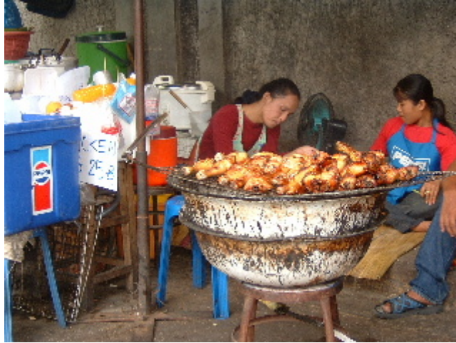
Tal com el somriure, alimentar-se al carrer forma part del tarannà tailandès. Bangkok. 29 març. 2003

Ens estem a Rambutri road, diuen que és el barri dels farang , si no anem errats aquest és el mot col·loquial que rebem els estrangers. Certament aquesta barriada està pensada pels viatgers de motxilla, desenes de cases amb lloguer d'habitacions, botigues d'internet, d'intercanvi de guies i llibres, i tot un reguitzell de furgonetes carregades de trastos, són antigues pertinences de viatgers que han refet la motxilla. Els amos jeuen a la tombona esperant que algú els desperti per vendre o comprar quelcom, "We buy everything" diu el cartellet que sobresurt entre els estris sobrants, cantimplores, sacs de dormir, ulleres i tubs d'aigua, un assortit que ens és familiar i que a nosaltres també ens fa nosa. Hi ha un carrerot que fa olor de net, és ple de gibrells d'aigua, escuma i roba estesa, deu ser un negoci de fer bugada, el seu reclam és un cartró guixat que ofereix rentar un quilo de roba al preu de 30 bats, que serien unes 120 pessetes.