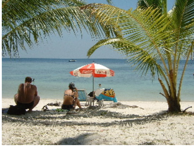
Les imatges dels fulletons turístics fan justícia a la realitat. Koh Tao. 5 abril. 2003